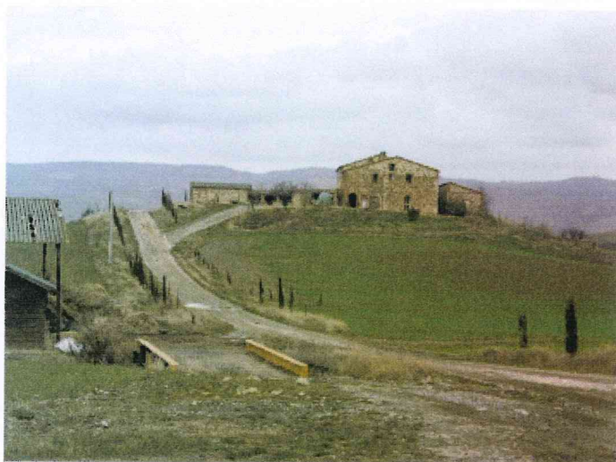
vista podere e pesa ubicata vicino ai fienili esistenti