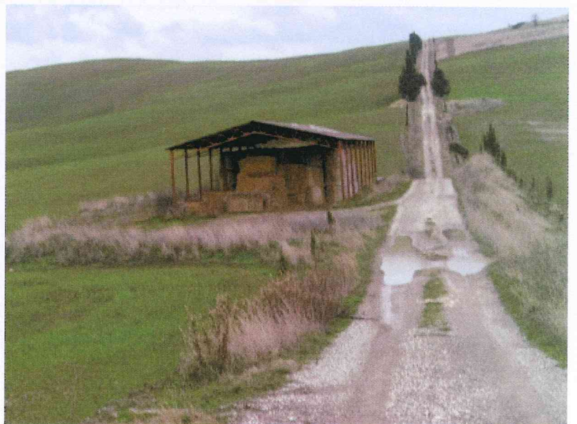
vista fienile in ampliamento area per insediamento stalle, magazzino e rimessa macchinari