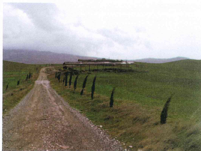
vista fienili esistenti in manutenzione