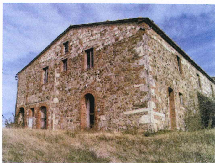
vista podere annesso, fienili