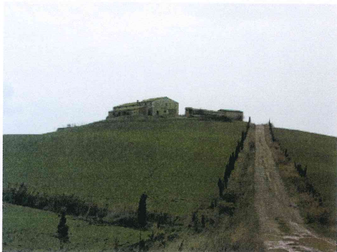
vista del podere da lago