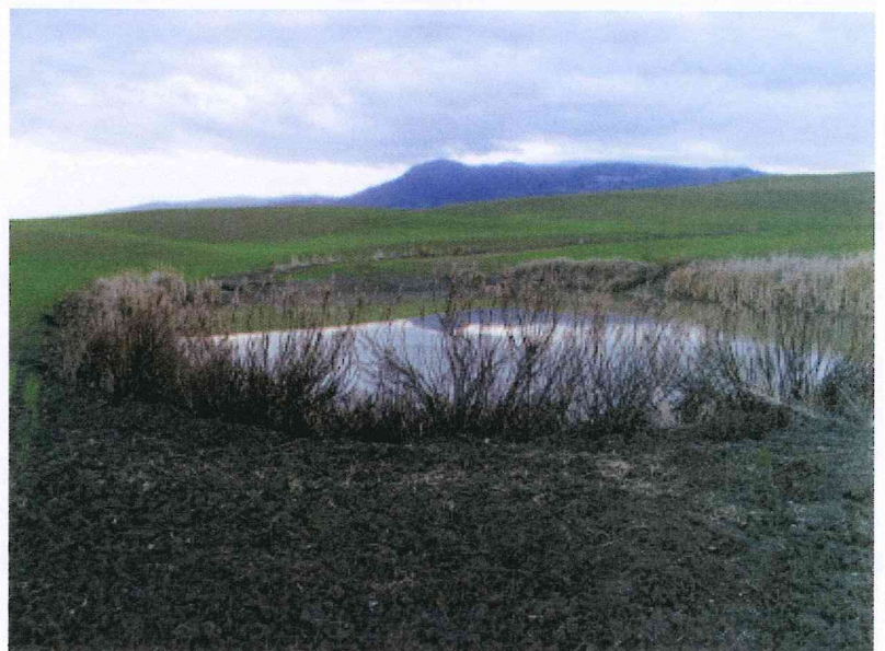
vista fienile in ampliamento, area nuove stalle e lago in ampliamento