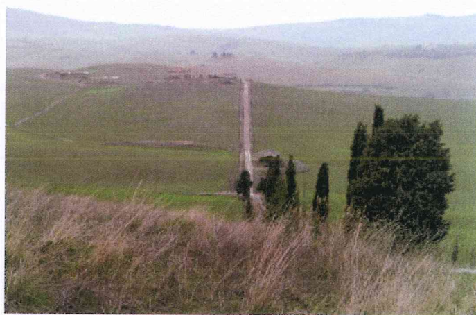
vista panoramica podere e strada di accesso esistente per area adibita a nuove stalle